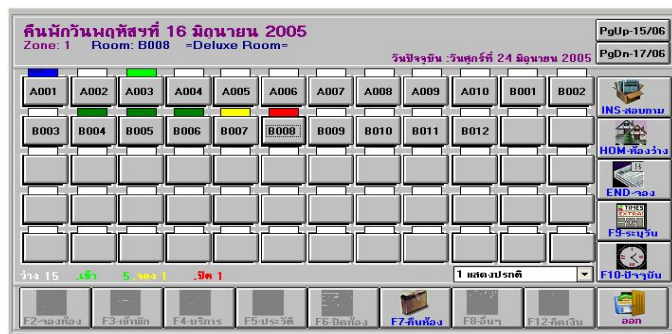
หน้าจอแสดงจำนวนห้อง และสถานะห้องแต่ละห้อง