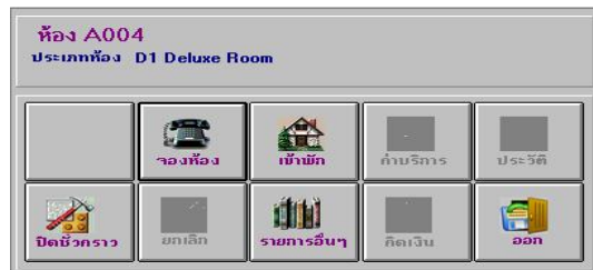
หน้าจอระบบการทำงานในแต่ละห้องพัก